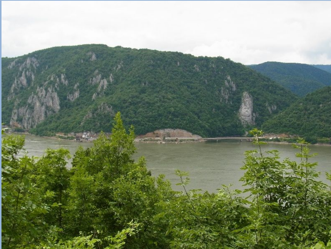
Decebal-Skulptur (2004) Dakerkönig Decebalus 85-106